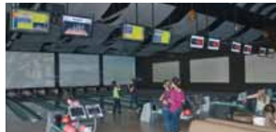
THUNDENBIRD BOWLING PANAMA CITY, PANAMA