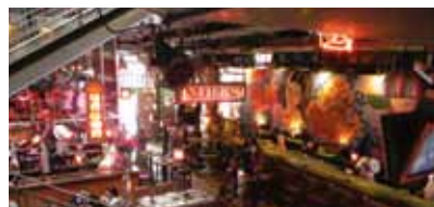
RESTAURANTE ANDRES CARNE DE RES BOGOTA, COLOMBIA