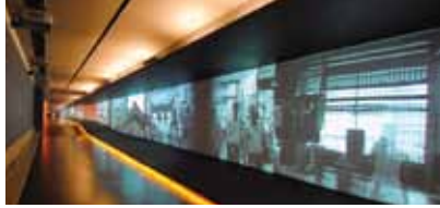
UNIVERSIDAD DE LOS ANDES BOGOTA, COLOMBIA